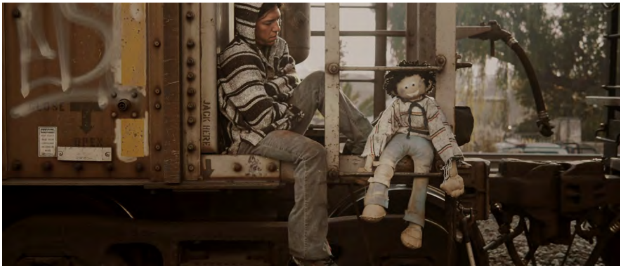
Imagen 1. Fotograma “LMRR Póster redux” proveniente de la película La muerte de Rafael Rivera (2019), dirigida por Martín Gerardo Valverde Watson. Se reproduce con el permiso de Martín Gerardo Valverde Watson.

Con esa información realizamos este artículo que consta de cuatro apartados. En el primero se delinearán algunas de las características de la industria cinematográfica en cada uno de los estados para entender el contexto en el que se elaboran las películas que se seleccionaron. En la segunda y la tercera parte del artículo se presenta la selección de películas de Baja California y Jalisco respectivamente, con una breve reseña y análisis. Y, finalmente, se dibujan algunas conclusiones sobre este ejercicio de recuperación cinematográfica en torno al cine migrante.