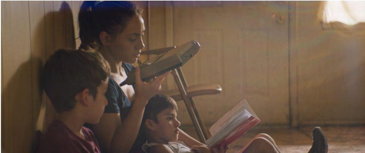
Imagen 4. Fotograma “Still 7” proveniente de la película Los Lobos (2019), dirigida por Samuel Isamu Kishi Leopo. Se reproduce con permiso de Samuel Kishi Leopo.